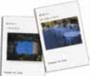
てらだ そう 寺田 操 (コラムニスト・エッセイスト)

第2金曜日 13:00~15:00 11月14日、12月12日 料金: 2,000円 (テキストなど提供)