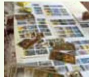
塩野浩子 (ルピナス遊学サロン 代表)

第2・4水曜日 10:30~12:00/13:30~15:00 (※夜間も相談) 11月12日・26日、12月10日・24日 料金: 2,500円