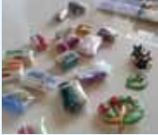
浅野千絵 (COLOR CROWN 主宰)

第1・3火曜日 10:30~12:00/13:00~14:30/15:00~16:30 11月4日・18日、12月2日・16日 料金: レッスン 3,000円 アクセサリ作り材料費 1,500円