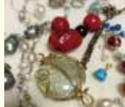
塩野浩子 (ルピナス遊学サロン 代表)

第2火曜日 10:30~12:00/13:30~15:00 11月11日、12月9日 料金: 2,000円 (材料費別)