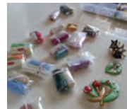
浅野千絵 (COLOR CROWN 主宰)

第1・3火曜日 10:30～12:00/13:00～14:30/15:00～16:30 9月1日(火)、15日(火)・10月6日(火)、20日(火) 料金：レッスン3,000円 アクセサリー作り材料費 1500円