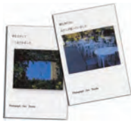
てらだ そう 寺田 操 (コラムニスト・エッセイスト)

第2金曜日 13:00～15:00 9月11日(金)・10月9日(金) 料金：2,000円 (テキストなど提供)