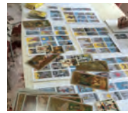
塩野浩子 (ルピナス遊学サロン 代表)

第2・4水曜日 10:30～12:00/13:30～15:00/18:00～19:30 9月9日(水)・10月14日(水)、28日(水) 料金：2,500円