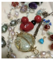
塩野浩子 (ルピナス遊学サロン 代表)

第2火曜日 10:30～12:00/13:30～15:00 9月8日(火)、10月13日(火) 料金：2,000円 (材料費別)