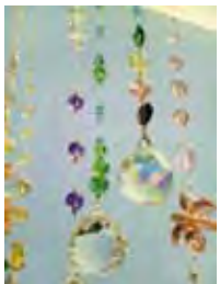
室内用サンキャッチャー

室内に光と虹をもたらし、それ自体もデザイン性の豊かなガラスのアクセサリー。新しい空間イメージを生み出す光のインテリアでもあります。繊細にカットされた素材を使いますが、作り方は簡単。どうぞ楽しく作り、ご自分の作品で幸せな心地に浸ってください。