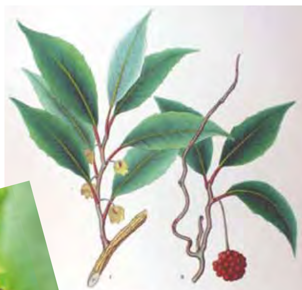
ビナンカズラ Flora Japonica, Sectio Prima (Tafelband).