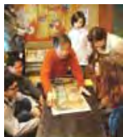
「上方浮世絵館」(大阪・法善寺)でのレクチャー風景