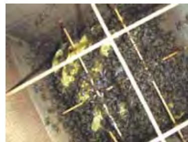
巣箱の中のミツバチ