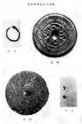
ヘボン塚古墳出土品 （『本山村史』より）

実体が残っていないので、墳墓とともに古代の人々の生活の場であった住居群も、イメージさえ浮かべることができませんが、近代以降の人間が、仕事や商売