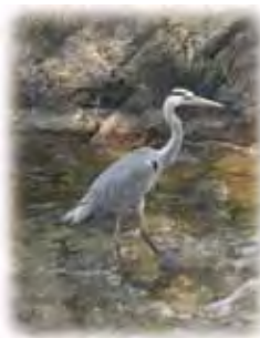
コサギ(右)と アオサギを発見!