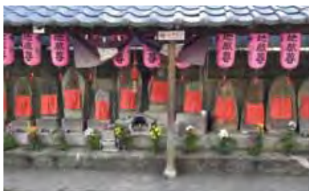
魚崎北町のお地藏さん

開発を実施したとき、土砂を運ぶダンプ通行用に造った道を整備した(罪滅ぼし?)もので“住吉川清流の道”と名づけられています。