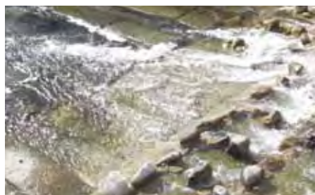
本当にキレイな水