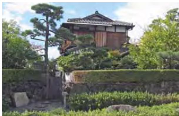
谷崎が住んだ家(移転)