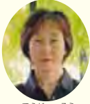
てらた そうじ 寺田 操 (コラムニスト・エッセイスト)