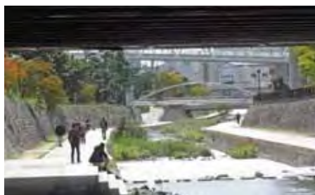
ときどきトンネル