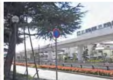
屋敷街の面影と新交通

開発を実施したとき、土砂を運ぶダンプ通行用に造った道を整備した(罪滅ぼし?)もので“住吉川清流の道”と名づけられています。