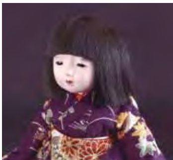
人形の価格は25万円~50万円

〈家族〉という時間の価値 —いま工房 朋の 市松人形が身にまとい あなたの思い出の着物が よみがえります